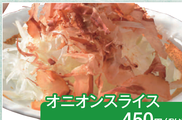
オニオンスライス