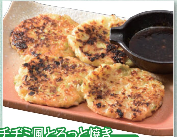
チチミ風とろっと焼き